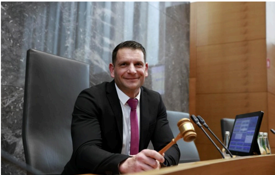
Зоран Стеванович виступає за поступове скасування антиросійських санкцій

Новий спікер парламенту Зоран Стеванович очолює партію Resni.ca, яку у медіа характеризують як євроскептичну.