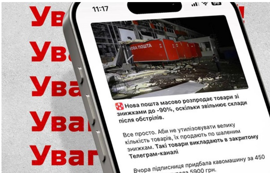
В Україні стрімко поширюється нова хвиля кібершахрайства

У соцмережах та Telegram-каналах поширюється інформація про нібито "розпродаж загублених" або "невитребуваних" посилок Нової пошти.