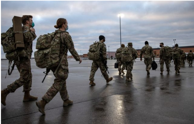
Фото: американські військові (Getty Images)

Обирайте перевірене - додайте РБК-Україна до улюблених джерел у Google