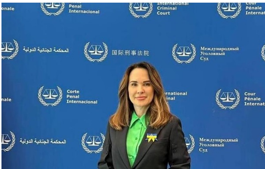
Фото: Facebook / Ірина Мудра Заступниця голови Офісу президента України Ірина Мудра

Україна закликає інші держави долучатися до Керівного комітету Спецтрибуналу, зазначили в Офісі президента.