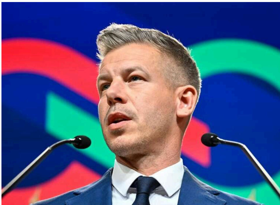
Кінець ери Орбана: опозиційна партія "Тиса" здобула конституційну більшість на виборах в Угорщині

За підсумками остаточного підрахунку голосів на парламентських виборах в Угорщині опозиційна партія «Тиса» Петера Мадяра отримує конституційну більшість і матиме 141 мандат.