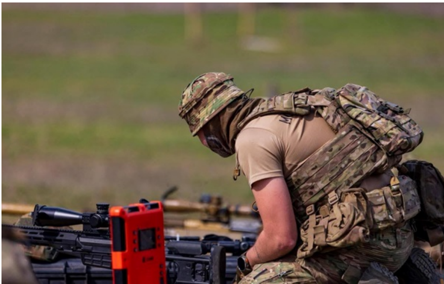
На Слов'янському напрямку українські захисники зупинили чотири спроби окупантів просунутися вперед

Російські загарбники за минулу добу два рази атакували в бік Новолатонівки на Куп'янському напрямку.