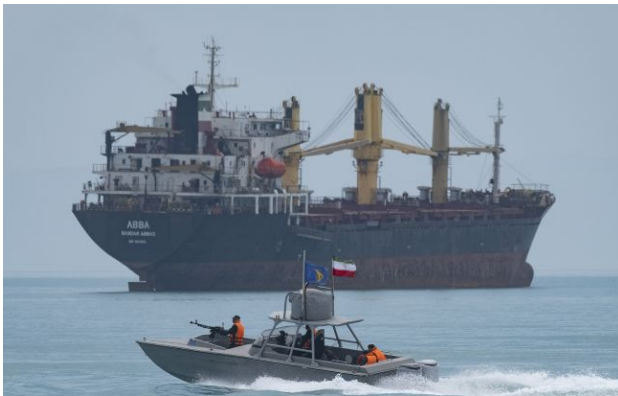
Фото: нафтовий танкер в Ормузькій протоці

Обирайте перевірене - додайте РБК-Україна до улюблених джерел у Google