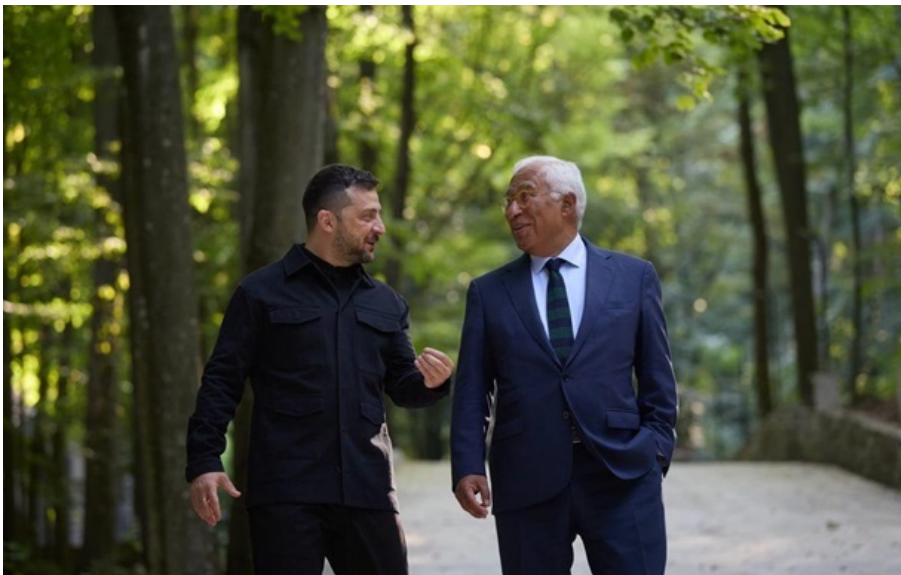
Зеленський і Кошта під час зустрічі в Ужгороді 5 вересня 2025 року

Україна буде повноправною частиною Євросоюзу. Йде робота до відкриття кластерів і подальших рішень, зазначив президент.