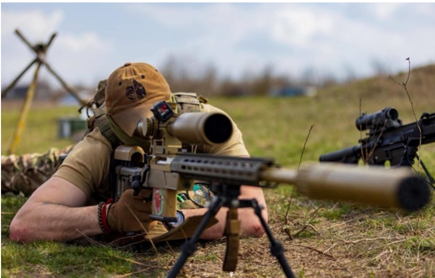
Загальні втрати особового складу армії РФ з 24.02.22 по 16.04.26 орієнтовно склали близько 1 315 070 осіб

Українські оборонці за останні 24 години знищили понад 1600 одиниць озброєння і військової техніки окупантів.