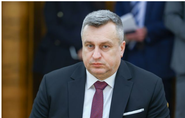
Фото: словацький політик Андрій Данко (Getty Images)

Обирайте перевірене - додайте РБК-Україна до улюблених джерел у Google