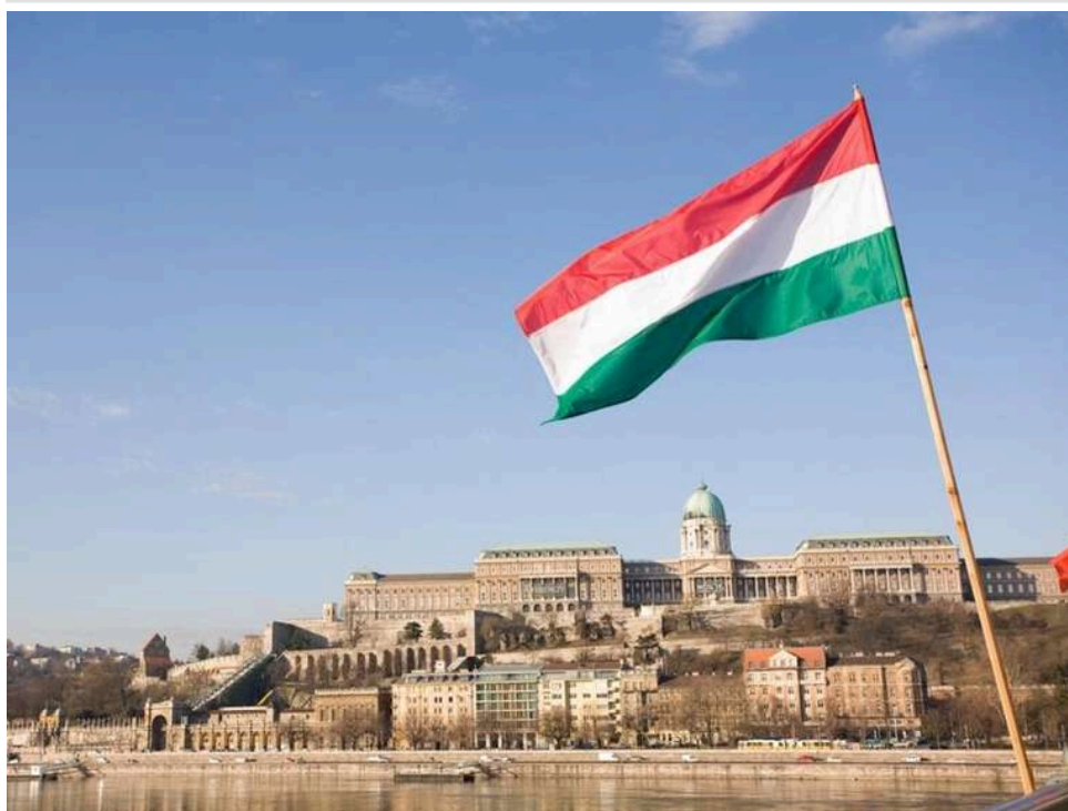
Угорщина виводить війська з об'єктів критичної інфраструктури, які охороняли через «загрозу з України»

Угорщина почала згортати військову присутність біля об'єктів критичної інфраструктури, куди раніше направили солдатів за наказом прем'єра Віктора Орбана. Йдеться про підрозділи, які патрулювали енергетичні об'єкти через заявлену владою «загрозу з боку України».