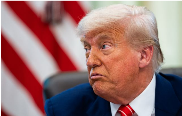
Фото: президент США Дональд Трамп

Обирайте перевірене - додайте РБК-Україна до улюблених джерел у Google