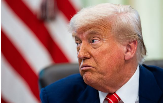
Фото: президент США Дональд Трамп

Обирайте перевірене - додайте РБК-Україна до улюблених джерел у Google