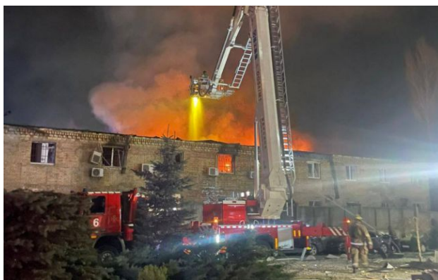
Фото: з'явилися перші фото наслідків удару РФ по Києву

В результаті нічного ракетного удару росіян по Києву відомо про чотирьох загиблих, також повідомляється про 21 пораненого.