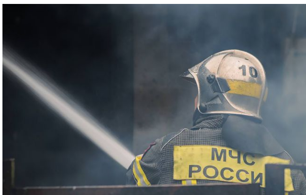
Фото: працівник російського МЧС на виклиці по ліквідації наслідків ударів дронів

Невідомі дрони знову атакують енергопромисловість Росії - цього разу зафіксовано влучання по порту та нафтобазі в Туапсе, де загорілись резервуари з нафтою.