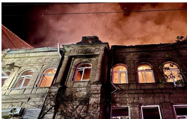
Фото: рятувальники та медики працюють на місцях пошкоджень (ДСНС України)

Росія вночі влучила по житлових кварталах Дніпра, через що спалахнули пожежі на кількох локаціях, а житлові будинки зазнали руйнувань. Відомо про 10 постраждалих через обстріли.