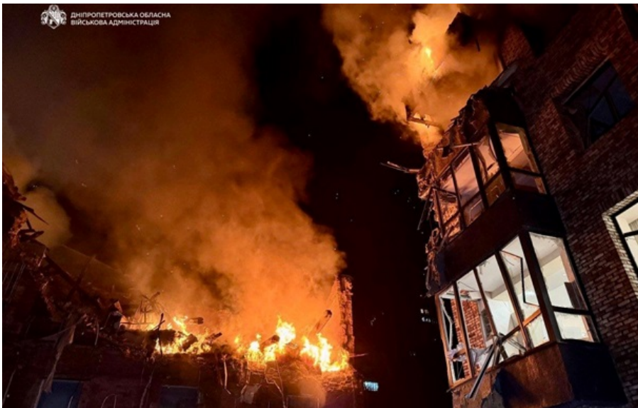
Наслідки атаки у Дніпрі

У столиці загинуло дві людини, а серед 13 постраждалих є медики. У постраждалих у Дніпрі діагностують черепно-мозкові травми, осколкові поранення, акубаротравми.