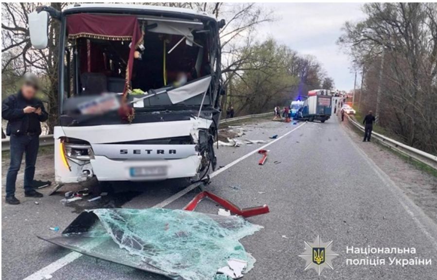
Місце ДТП

Водій вантажівки отримав травми, несумісні з життям. Водія автобуса та ще двох пасажирів обстежують лікарі.