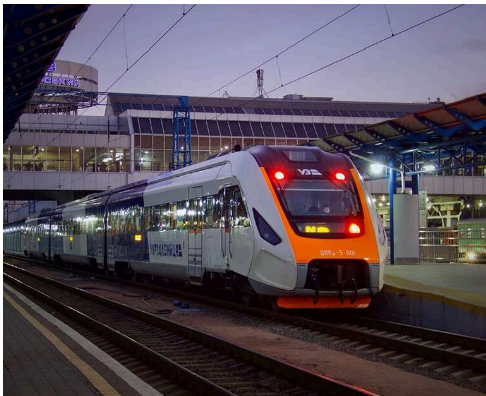
Радіус безпеки – 50 км: як "Укрзалізниця" евакує пасажирів під час підльоту "шахедів"

"Укрзалізниця" застосовує спеціальні протоколи безпеки під час загрози від дронів-камікадзе типу "Шахед". Якщо безпілотник наближається на небезпечну відстань, пасажирські поїзди зупиняють, а пасажирів евакуують із вагонів.