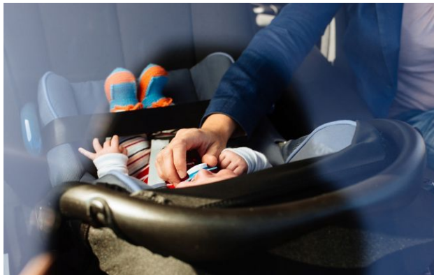
Фото: дитина в автокріслі

Обирайте перевірене - додайте РБК-Україна до улюблених джерел у Google