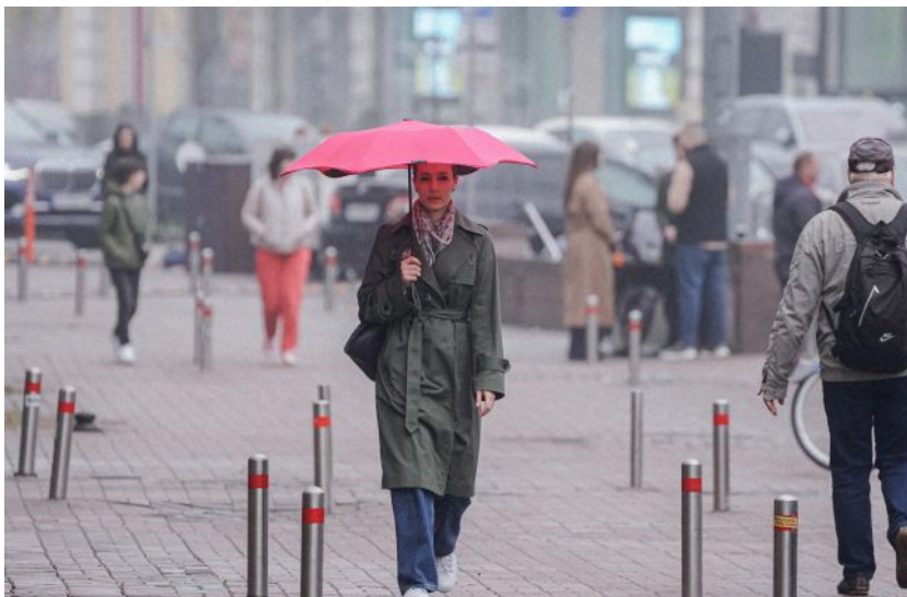
Завтра в Україні буде тепло, але в деяких областях ймовірний дощ