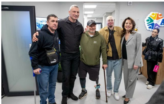
Віталій Кличко з ветеранами під час відкриття простору "Аскольд"

В Києві відкрили новий простір Київського міського центру соціальної, психологічної, професійної та трудової реабілітації "Аскольд".