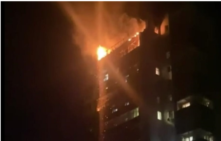
У Сумах палає багатоповерхівка

Після удару безпілотників палає багатоквартирний будинок. Рятувальники проводять евакуацію людей.