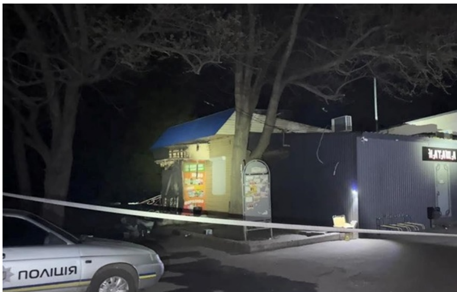
Поліція встановила осіб, причетних до злочину, та затримали їх у сусідньому населеному пункті

Пригода сталася пізно ввечері 1 травня в місті Шахтарське Синельниківського району на Дніпропетровщині.