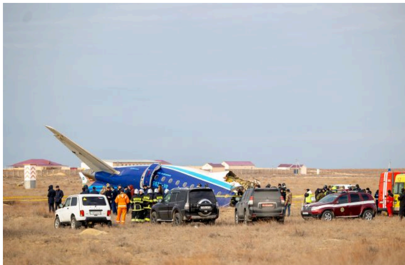
Фото: РФ визнала провину за збитий літак азербайджанської AZAL