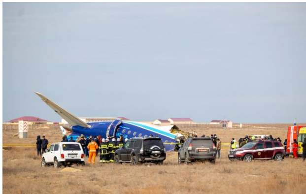
Фото: РФ визнала провину за збитий літак азербайджанської AZAL (Getty Images)

Обирайте перевірене - додайте РБК-Україна до улюблених джерел у Google