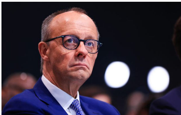
Фото: канцлер Німеччини Фрідріх Мерц

Німеччина обмежуватиме кількість українських чоловіків, які шукають притулку у країні, і сприятиме їхньому поверненню додому.