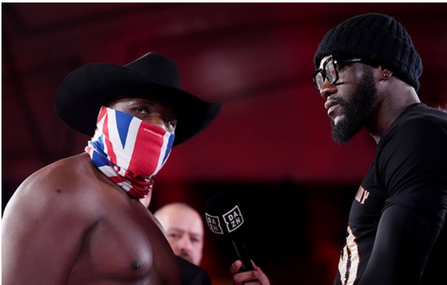
Дерек Чісора – Деонтей Вайлдер

Колишній чемпіон світу за версією WBC Деонтей Вайлдер вийде на ринг проти непередбачуваного Дерек Чісори.