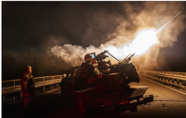
Фото: ППО працює по "Шахедах" у столиці (Getty Images)

Обирайте перевірене - додайте РБК-Україна до улюблених джерел у Google