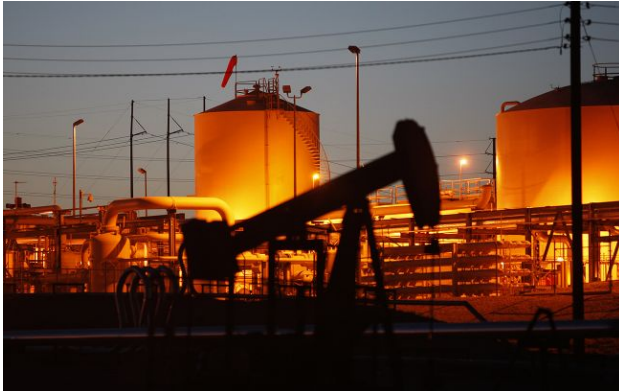
Фото: зараз питання в тому, хто яка з країн витримає економічний тиск довше

Обирайте перевірене - додайте РБК-Україна до улюблених джерел у Google