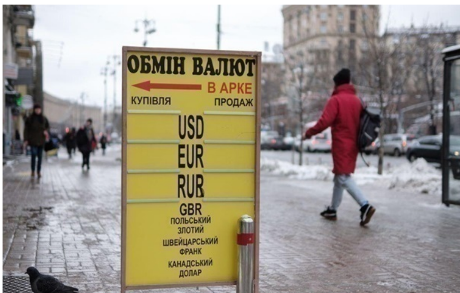
Обмінники та банки оновили курс валют

В обмінниках вартість американської валюти тільки за пів дня піднялась на 40-70 копійок. Максимальна ціна – 44,75 гривень за долар.