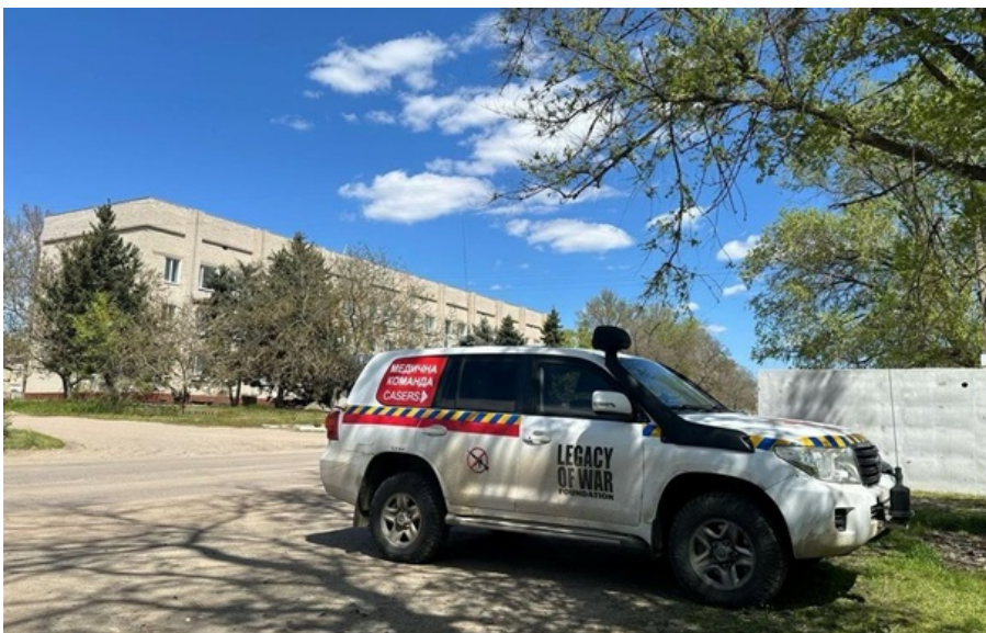
(ілюстративне фото) Потерпілих у стані середньої тяжкості помістили в лікарню

Ворожий удар призвів до поранень чотирьох людей - жінки 57 та 52 років й чоловіки 54 та 51 року.