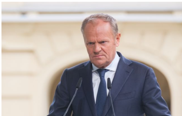
Фото: Дональд Туск (Віталій Носач, РБК-Україна)

Обирайте перевірене - додайте РБК-Україна до улюблених джерел у Google