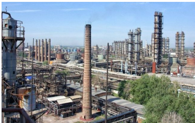
Фото: дрони атакували нафтохімічні підприємства у російському Башкортостані (росЗМІ)

У середу, 15 квітня, дрони атакували нафтохімічні підприємства у російській республіці Башкортостан.