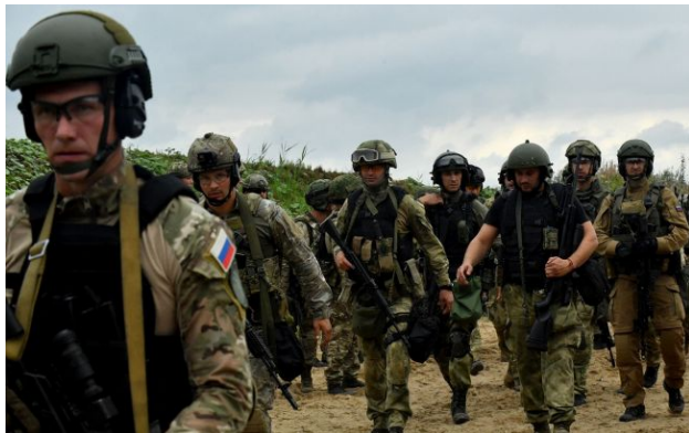
Фото: російські окупанти

Росія обманом залучає мешканців Криму до своєї армії, обіцяючи "службу вдома". На практиці ж кримчан відправляють за межі півострова для участі у війні проти України.