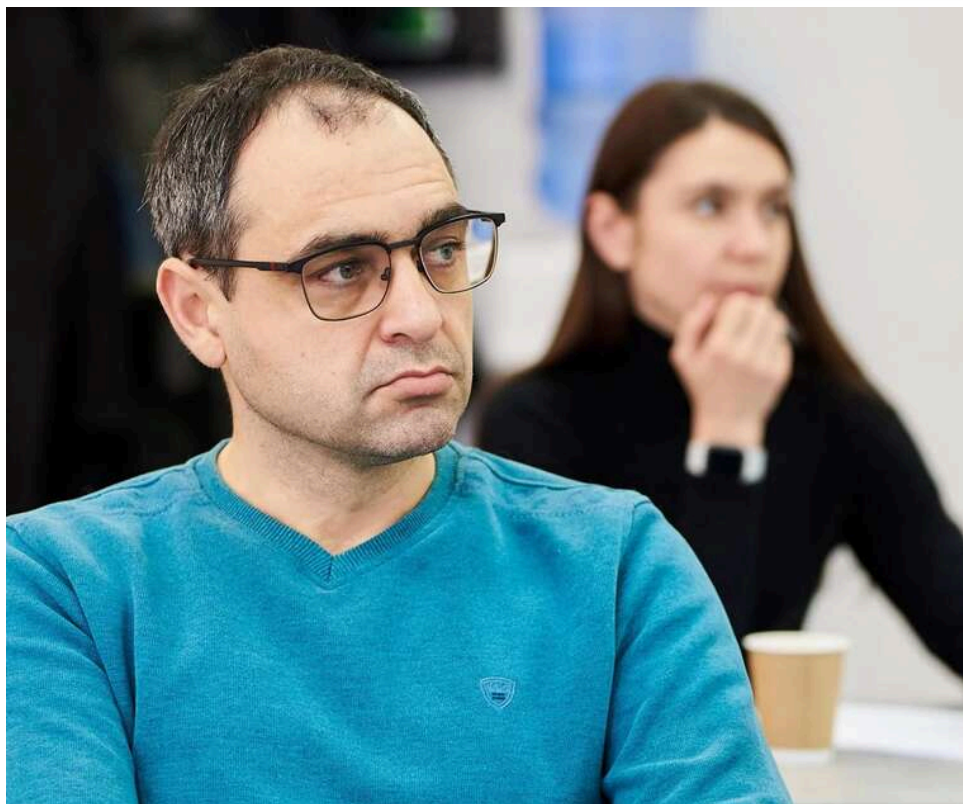
Ризики для Одеси та Києва: чому відновити водопостачання після обстрілів значно складніше, ніж електрику