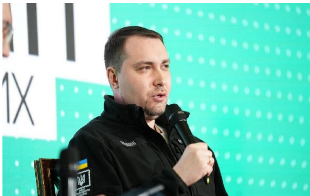
Фото: керівник Офісу президента України Кирило Буданов (t.me/Kyrylo_Budanov_Official)

Україна має відкинути ілюзії щодо швидкого повернення громадян з-за кордону, оскільки для цього необхідні реальні гарантії безпеки та міцний економічний фундамент.