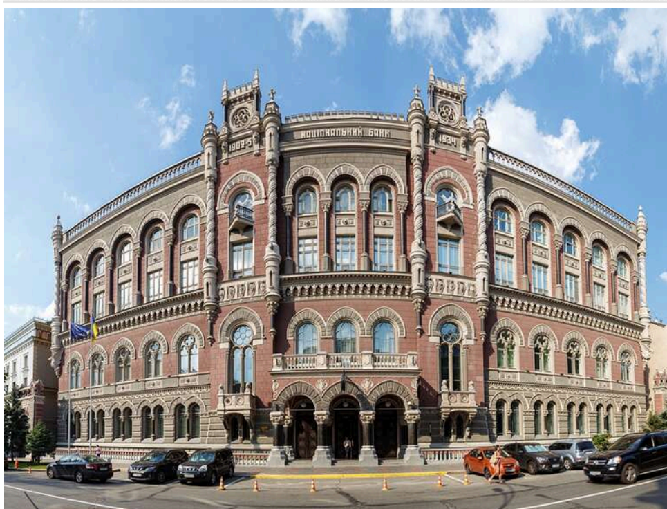
Всупереч вимогам МВФ: Як "плівки" Міндіча та Умерова ставлять під удар фінансову систему України