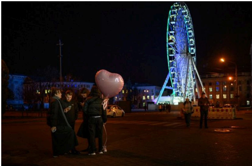
Ілюстративне фото: в Україні 16 квітня відключення світла не прогноуються