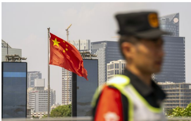
Фото: у Пекіні вважають заходи США незаконними

Обирайте перевірене - додайте РБК-Україна до улюблених джерел у Google