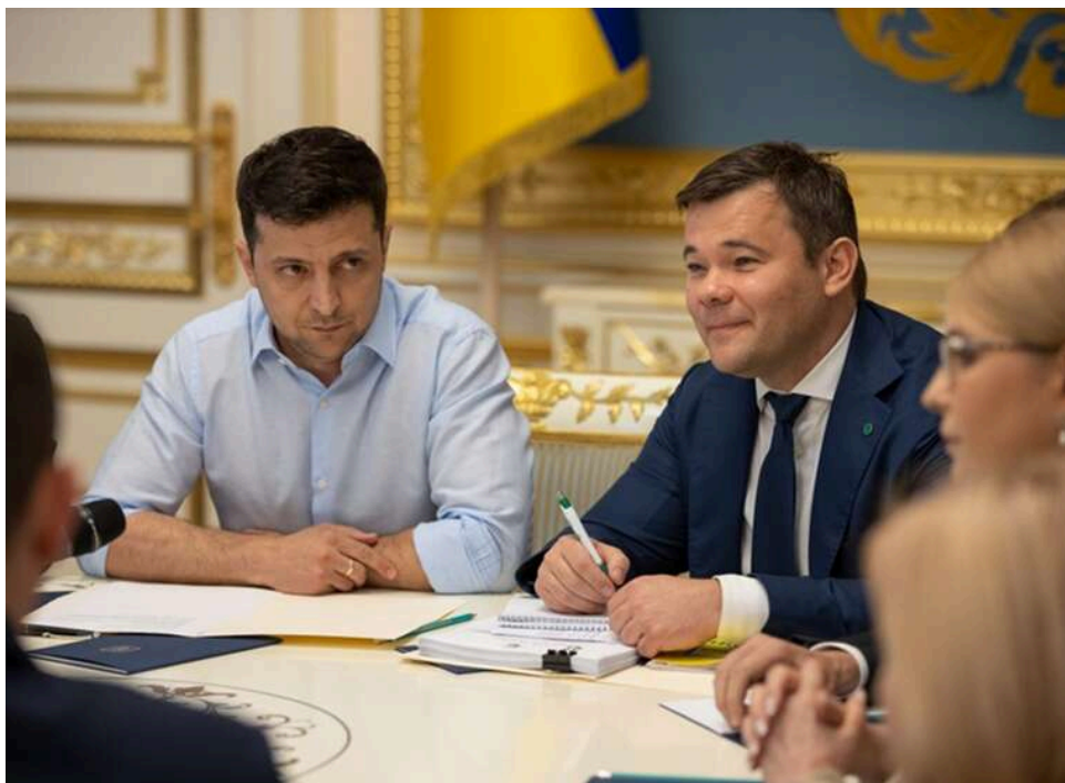
Зеленський наклав безстрокові санкції на ексголови Офісу президента Андрія Богдана

Президент Зеленський ввів санкції проти колишнього керівника свого Офісу Андрія Богдана.