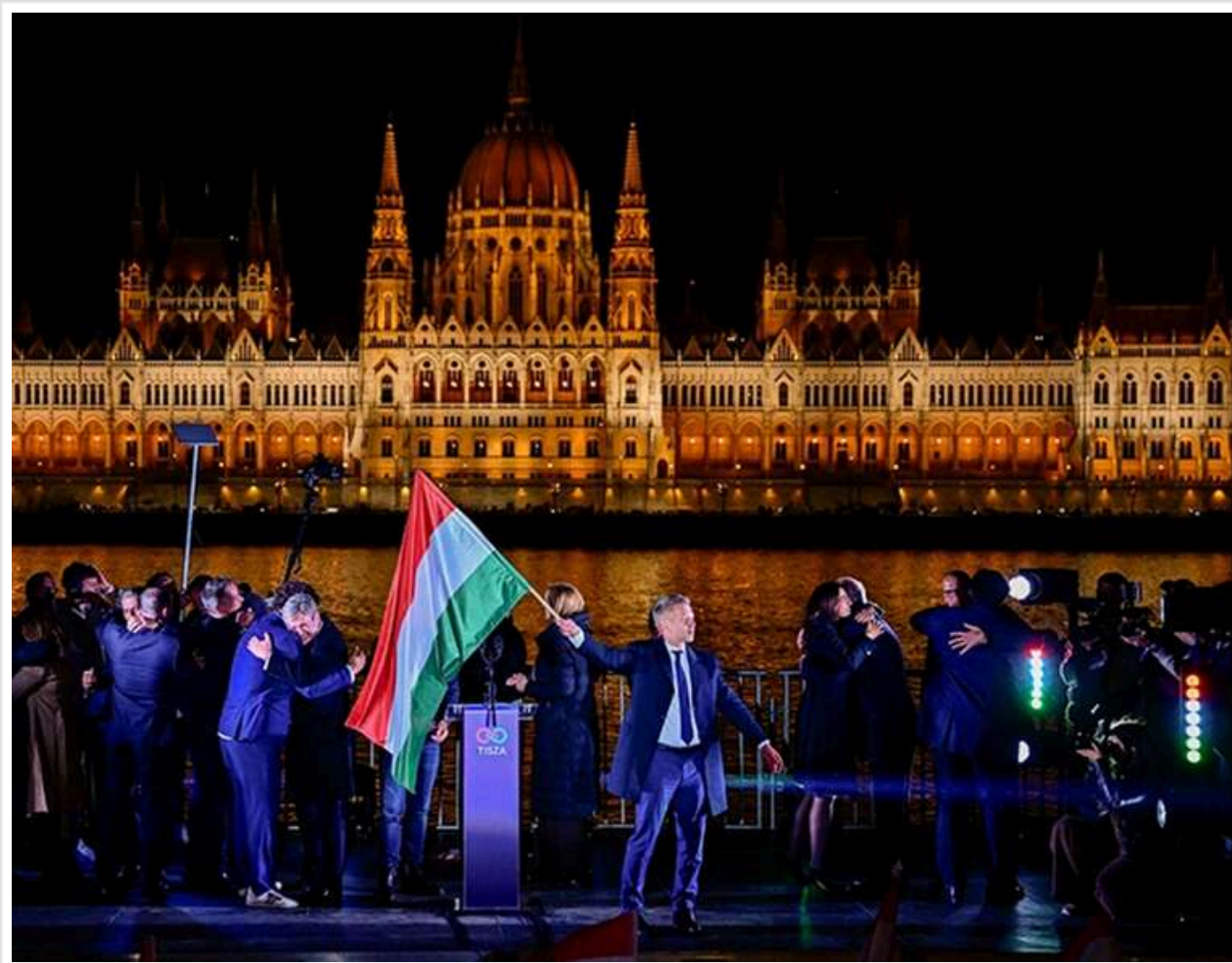
Повернення до імперських традицій: нове Законодавче зібрання Угорщини відкриють гімном Секейського краю та присягою на короні

Нове Законодавче зібрання Угорщини вперше почне роботу з гімну Секейського краю – угорської національної автономії на території Румунії.