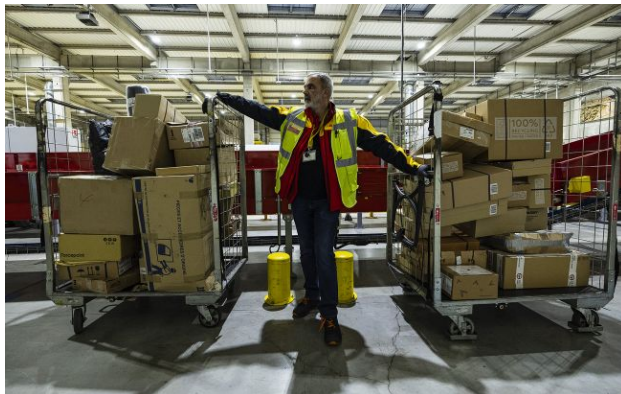
Фото: законодавець хоче ввести податки майже на всі посилки з-за кордону

Епоха пільгових покупок на іноземних маркетплейсах добігає кінця. Верховна Рада готується скасувати звільнення від ПДВ для міжнародних посилок вартістю до 150 євро. Згідно з новими правилами, податок у 20% доведеться сплачувати навіть за найдрібніші замовлення з AliExpress чи Temu.