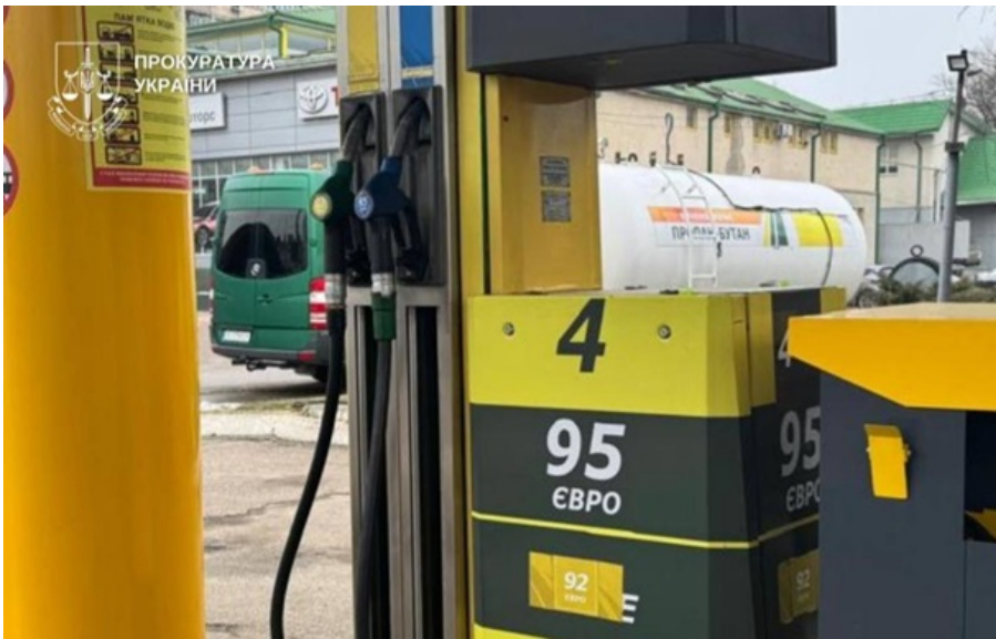
Викрито мережу підпільних АЗС

Припинено роботу трьох автозаправних станцій: двох у Чернівецькій області та однієї у Хмельницькій.