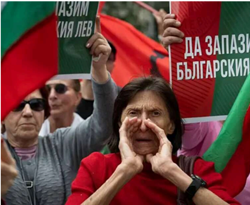
WP: Болгарія стає центром боротьби за вплив у ЄС після послаблення Орбана

Болгарія перетворюється на нову арену боротьби за вплив в ЄС на тлі послаблення позицій Орбана, – WP.