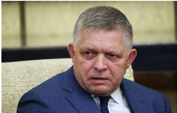
Фото: Роберт Фіцо (Getty Images)

Обирайте перевірене - додайте РБК-Україна до улюблених джерел у Google