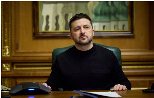
Фото: президент України Володимир Зеленський (facebook.com zelenskyy.official)

Обирайте перевірене - додайте РБК-Україна до улюблених джерел у Google