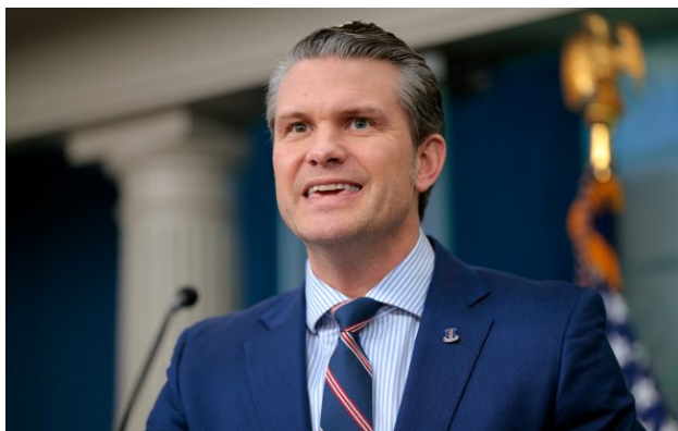
Фото: глава Пентагону Піт Херсет (Getty Images)

Обирайте перевірене - додайте РБК-Україна до улюблених джерел у Google