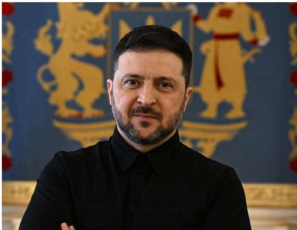
Зеленський увійшов до трійки лідерів: легендарна співачка Доллі Партон очолила рейтинг симпатій американців

Американська співачка та філантропка Доллі Партон посіла перше місце в рейтингу симпатій американців, значно випередивши провідних політиків. До трійки лідерів із позитивним рейтингом також увійшов президент України Володимир Зеленський, свідчить опитування UMass/YouGov.