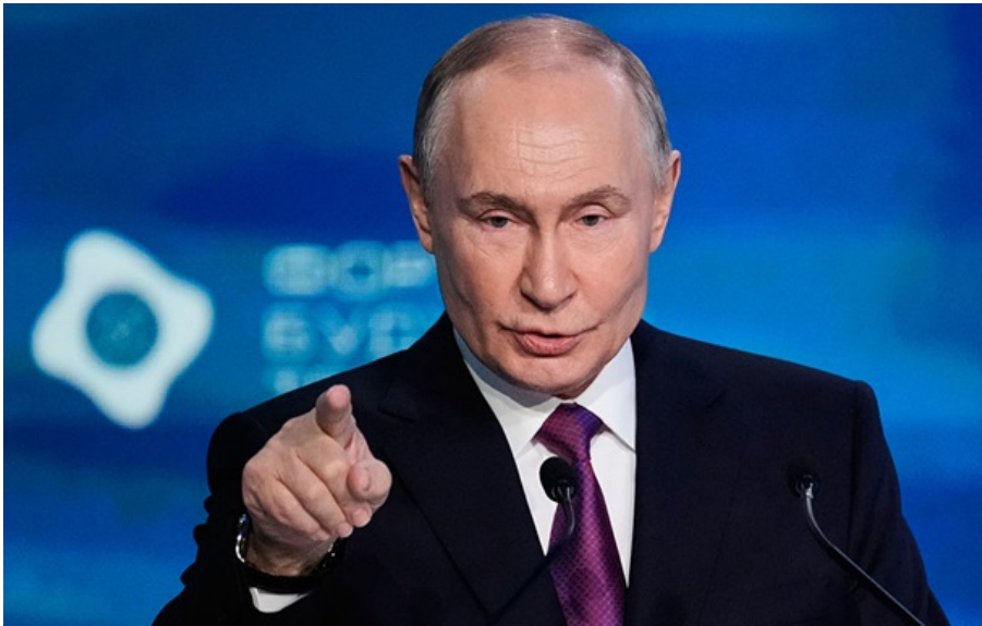
"Військову машину" Путіна підживлюють надприбутки від продажу нафти

Оскільки війна з Іраном призводить до зростання цін на нафту, це дає до 150 мільйонів доларів додаткового прибутку для РФ.